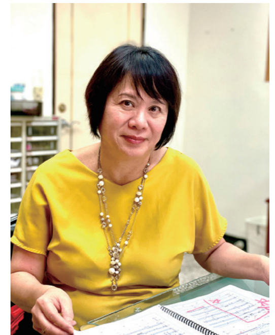
身為作曲家，陳士惠用音樂參與社會議題，以女性視角詮釋當代，傳達理念。