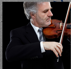
小提琴 | 萊納·霍內克 Violin: Rainer Honeck