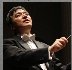
指揮 | 水藍 Conductor: Lan Shui